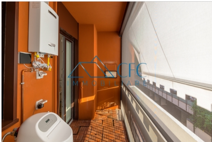
PIANO TERRA H=2.50